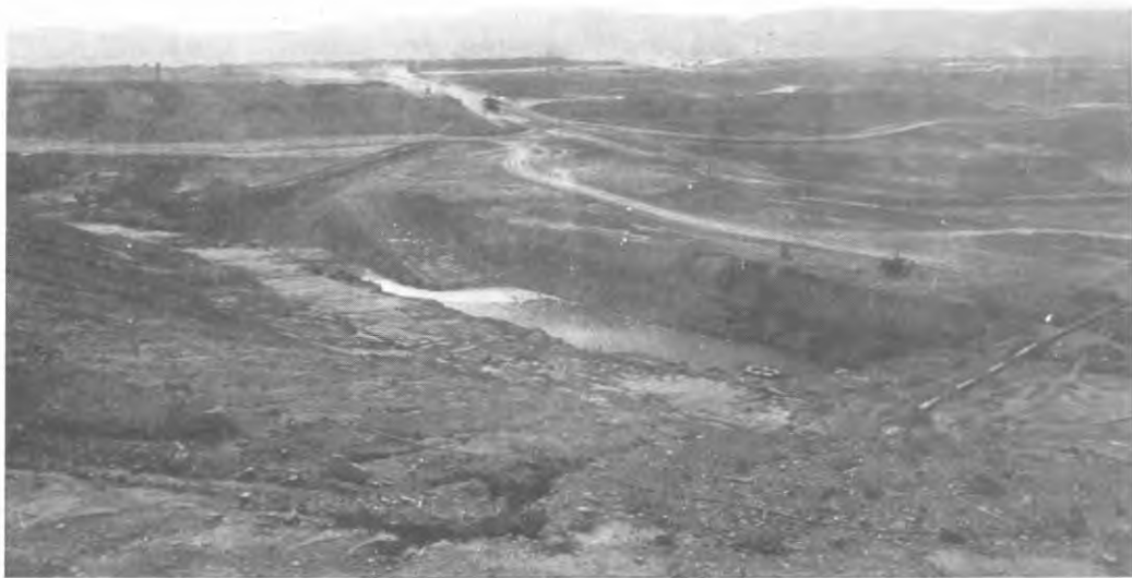
Aspecto general de la mina a Tajo abierto en el Cerrejon Zona Norte.