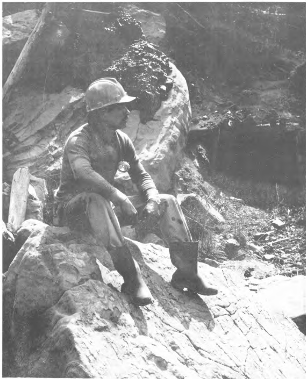
Minero en la Región de Samaca - Boyacá