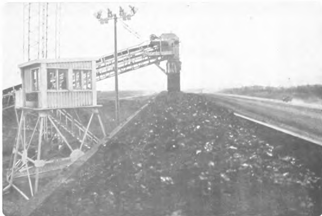
Banda Transportadora en apilamiento de carbón - Exportación anticipada - Cerrejón Zona Norte